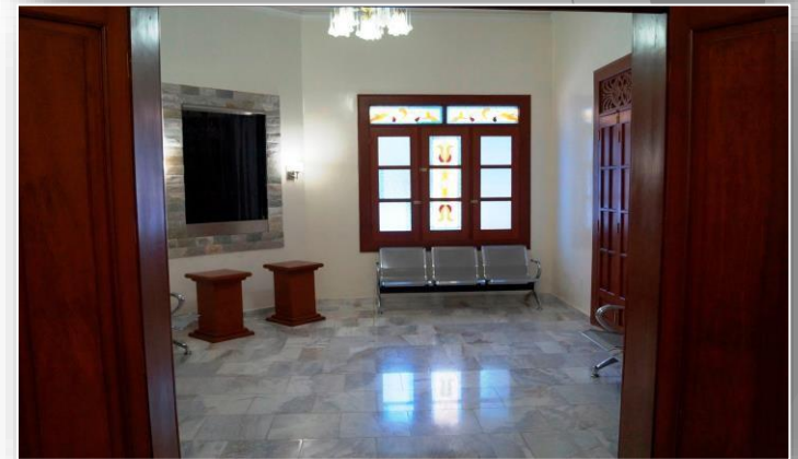
Barranquilla _ Cra. 53 No 59 _ 55