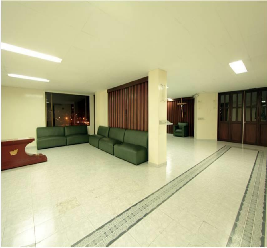
Av. Cll 68 No 39 - 02