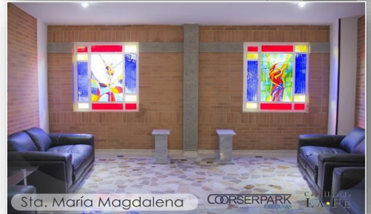
Sta. María Magdalena