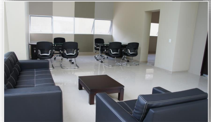
Leticia _ Av. Vásquez Cobo Cra 10 No 15- 75