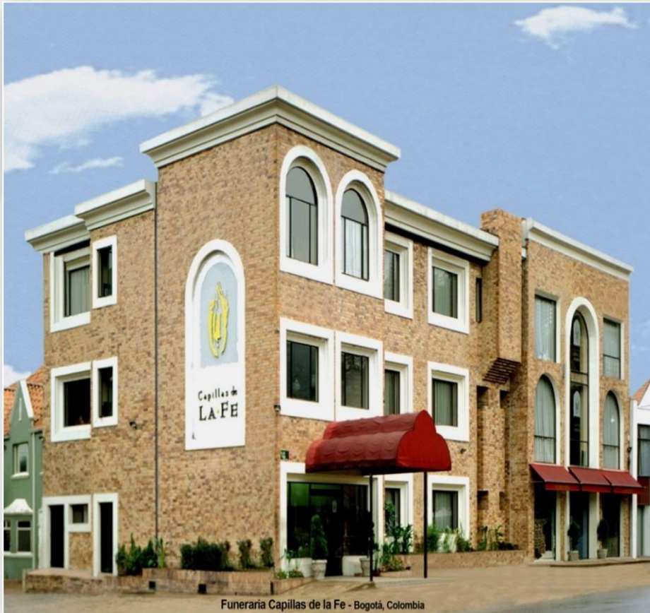
Funeraria Capillas de la Fe - Bogotá, Colombia