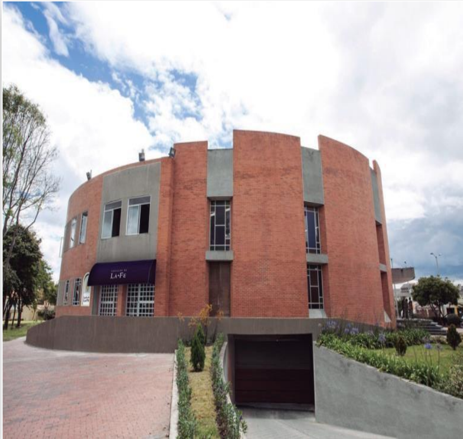
Cra 19 No 154 - 76